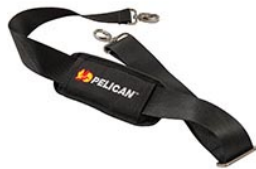
9487 Correa para hombro acolchada