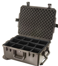
iM2720-X0002 With Padded Dividers