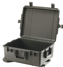
iM2720-X0000 No Foam