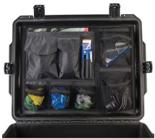
iM27XX-UTILITYORG Organizador de accesorios