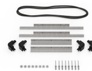
iM2200-M4-BEZEL-L Bisel de la tapa (métrico)