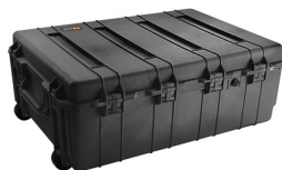
1730NF No Foam