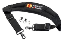
iM-STRAP-S-VER2 Padded Shoulder Strap