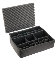
iM2700-DIV Комплект мягких модульных перегородок