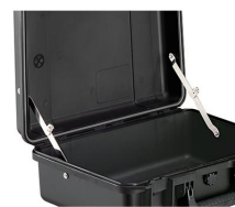
iM-LIDSTAY Кронштейн для опоры откидной крышки