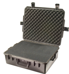
iM2700-X0001 With Foam