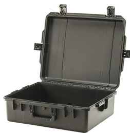
iM2700-X0000 No Foam