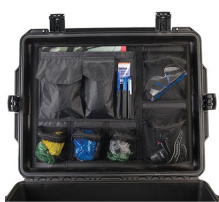
iM27XX-UTILITYORG Отделения для предметов общего назначения