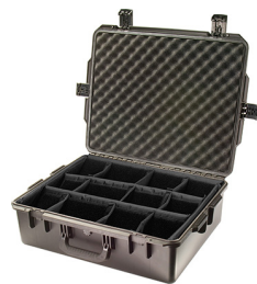
iM2700-X0002 With Padded Dividers