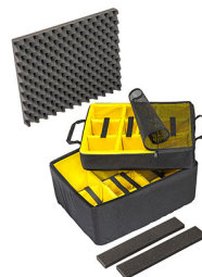
1607AirDS Set di divisori imbottiti