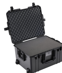
1607WF With Foam