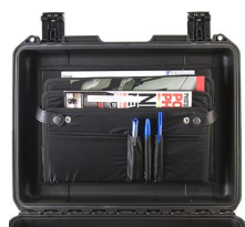
iM24XX-LIDORG Pochette couvercle