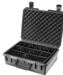
iM2400-X0002 With Padded Dividers