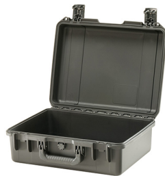
iM2400-X0000 No Foam