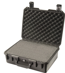
iM2400-X0001 With Foam