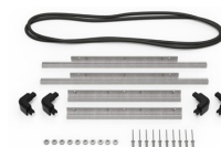
iM2400-M4-BEZEL-L Lunette du couvercle (métrique)