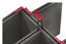
iM2400-TREK Kit de séparation de la valise TrekPak