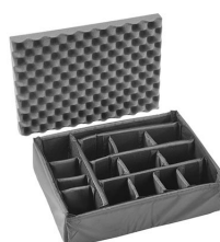
iM2400-DIV Cloison en mousse