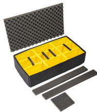
1615AirDS Cloison en mousse