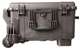
1620MNF No Foam