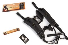
RucPac-normal Conversión de mochila RucPac estándar Hardcase