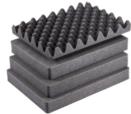
1507AirFS Juego de 5 piezas de espuma de recambio