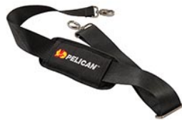
9487 Correa para hombro acolchada