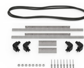
iM2306-M4-BEZEL-L Bisel de la tapa (métrico)