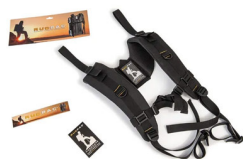
RucPac-normal RucPac Standard Hardcase Rucksack-Konvertierung