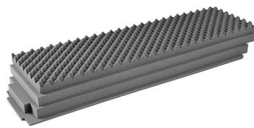
1745AirFS 4 pc. Pick N Pluck™ Foam Set