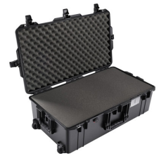
1615WF With Foam