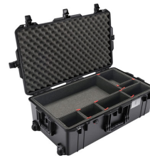
1615TP With TrekPak Divider System