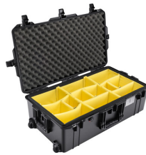
1615WD With Padded Dividers