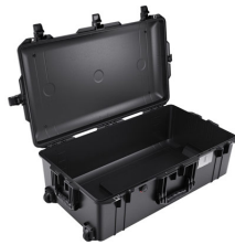
1615NF No Foam