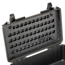
1535MP EZ-Click™ MOLLE Panel