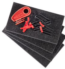
1506TPKIT TrekPak Koffer Teiler Kit