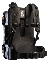
RucPac-Pro-1 RucPac Pro Hardcase Rucksack- Konvertierung