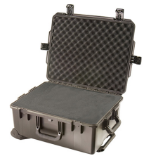
iM2720-X0001 With Foam