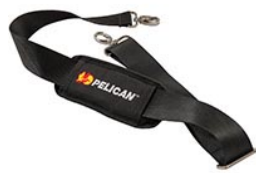
9487 Padded Shoulder Strap