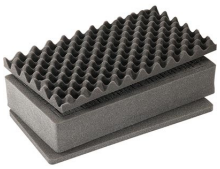
1525AirFS Juego de 3 piezas de espuma de recambio