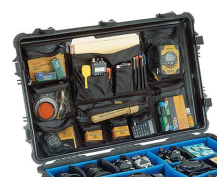
1659 Organizador de material fotográfico/tapa