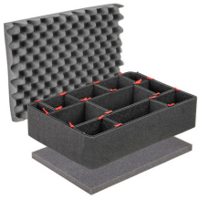
1520TPKIT Kit de divisores TrekPak