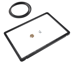
1520PF Panel de adaptación para aplicación especial