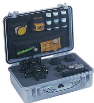
1508 Organizador de tapa para material de fotografía