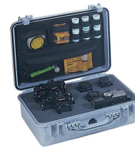
1508 Organizador de tapa para material de fotografía