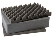
1451 Juego de 3 piezas de espuma de recambio