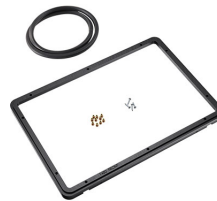
1450PF Panel de adaptación para aplicación especial