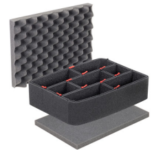
1450TPKIT Kit de divisores TrekPak