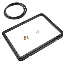
1400PF Panel de adaptación para aplicación especial