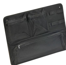
1569 Organizador de tapa