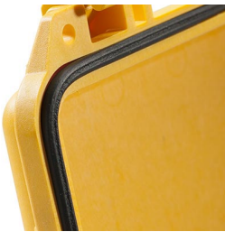
1463 Junta tórica de repuesto