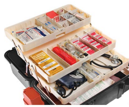
1466 Sistema de bandejas para 1460EMS