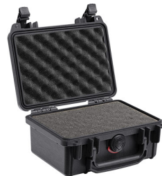
1120WF With Foam