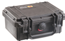
1120NF No Foam