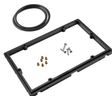
1120PF Panel de adaptación para aplicación especial