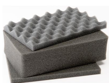
1121 Juego de 3 piezas de espuma de recambio