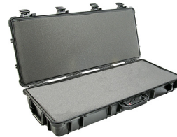
1700WF With Foam