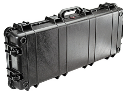
1700NF No Foam