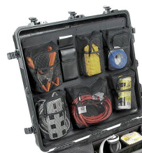
1699 Organizador de tapa