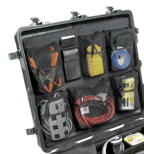
1699 Organizador de tapa