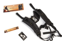
RucPac-normal Conversión de mochila RucPac estándar Hardcase