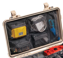
1519 Organizador de tapa