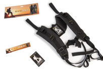
RucPac-normal Conversión de mochila RucPac estándar Hardcase