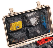
1519 Organizador de tapa