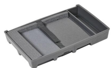
1499C Computer Bottom Insert