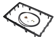
1490PF Panel de adaptación para aplicación especial