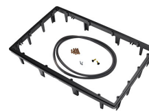
1490PF Panel de adaptación para aplicación especial