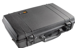
1490NF No Foam