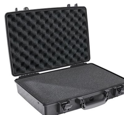
1490WF With Foam