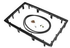
1490PF Panel de adaptación para aplicación especial