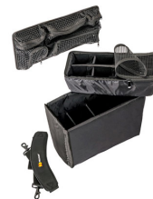
1435 Divisores acolchados