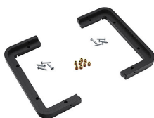
1430PF Panel de adaptación para aplicación especial