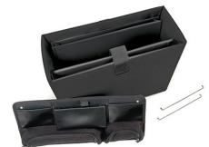
1436 Office Divider Kit