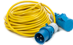
9606E Power Cable