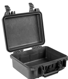
1200NF No Foam