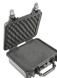
1200WF With Foam