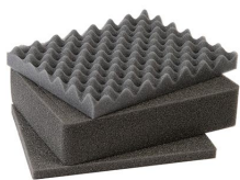
1201 Juego de 3 piezas de espuma de recambio