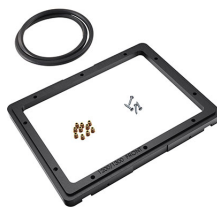
1200PF Panel de adaptación para aplicación especial