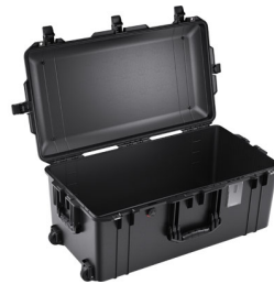
1626NF No Foam