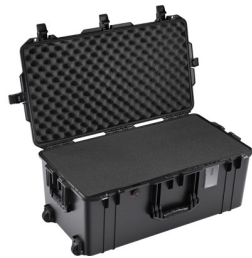
1626WF With Foam