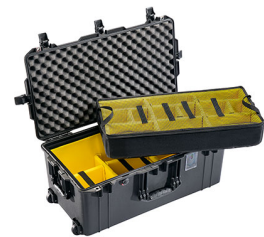
1626WD With Padded Dividers