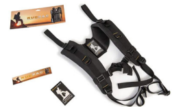
RucPac-normal Conversión de mochila RucPac estándar Hardcase