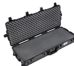
1745WF With Foam