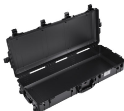
1745NF No Foam