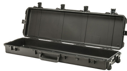
iM3300-X0000 No Foam