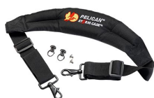
iM-STRAP-S-VER2 Correa para hombro acolchada