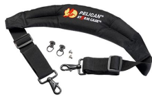
iM-STRAP-S-VER2 Correa para hombro acolchada