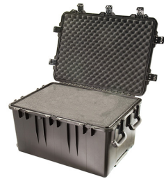
iM3075-X0001 With Foam