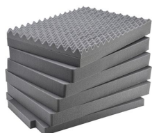
iM3075-FOAM Juego de 7 piezas de espuma de recambio