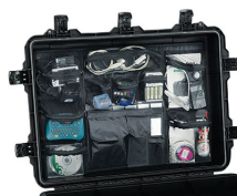
iM3075-UTILITYORG Organizador de accesorios