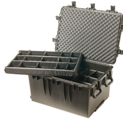
iM3075-X0002 With Padded Dividers