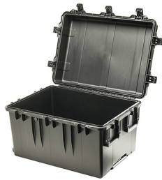
iM3075-X0000 No Foam