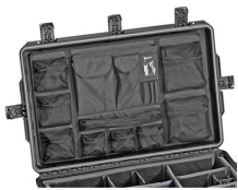
iM2875-UTILITYORG Organizador de accesorios