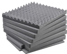
iM2875-FOAM Juego de 7 piezas de espuma de recambio