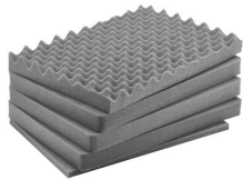
iM2600-FOAM Juego de 5 piezas de espuma de recambio