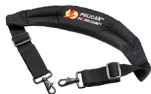
iM2370-STRAP-S Correa para hombro acolchada removible