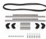
iM2306-M4-BEZEL-L Bisel de la tapa (métrico)