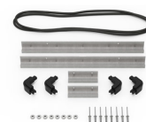
iM2306-MBEZ-B Bisel de la base (métrico)