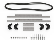
iM2306-M4-BEZEL-L Bisel de la tapa (métrico)