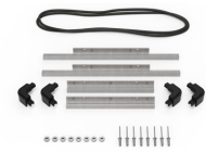
iM2200-M4-BEZEL-L Bisel de la tapa (métrico)