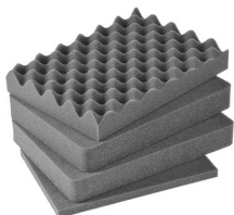
iM2100-FOAM Juego de 4 piezas de espuma de recambio