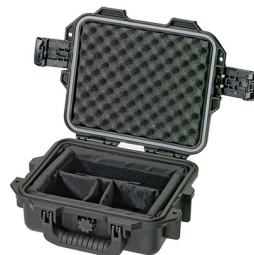
iM2050-X0002 With Padded Dividers