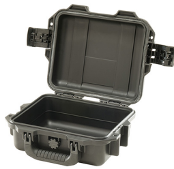
iM2050-X0000 No Foam