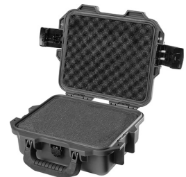
iM2050-X0001 With Foam